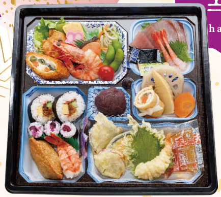
3-1 ランチ華 寿司入り 本体価格 2,800 円 (税込3,024円) サイズ：縦318×横318mm 〈アレルギー〉えび・かに・小麦・卵・乳成分