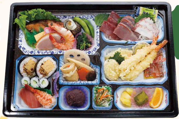
えん 縁 en