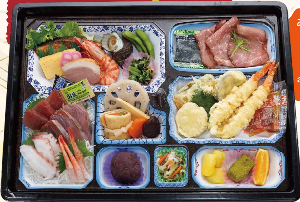
あかつき 暁 akatuki